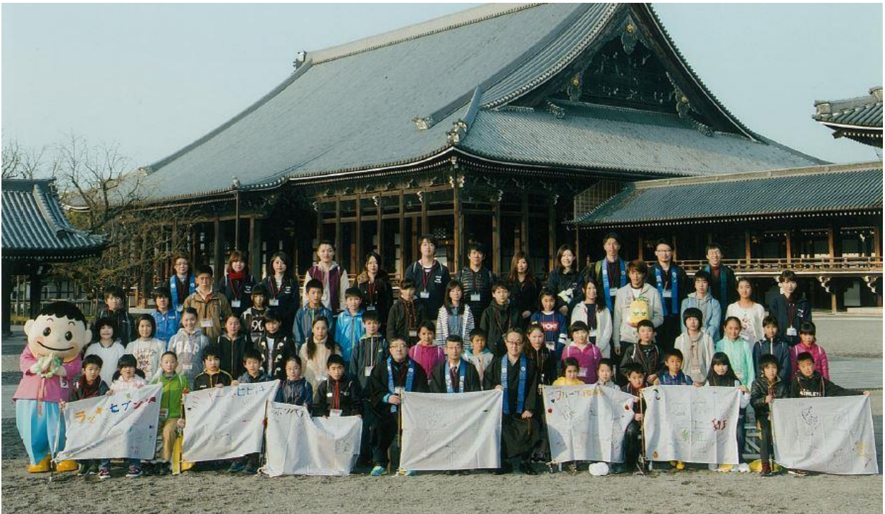
第39回少年連盟中央研修会

2016(平成28)年3月29日(火)～31日(木)、本願寺間法会館で行われた第39回少年連盟中央研修会の報告です。