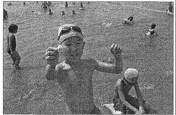
子ども達の感想文です。 ※原文のまま掲載します。

本山での研修を修了した方がゲームリーダーを務めるなど心強く思うことも多くありました。教区での活動にとどまらず、それぞれの組や、お寺での子ども会活動につながっていくことを念じて止みません。