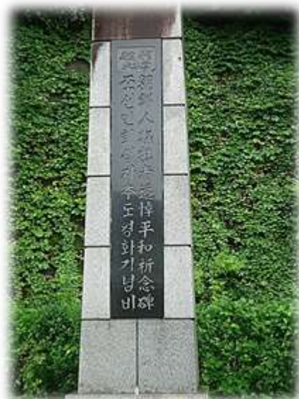
朝鮮人犠牲者追悼平和記念碑