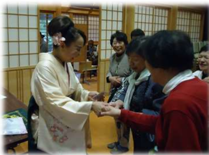
参加者とのふれあい

内容豊かでとても楽しい講演でした。講演や歌の中で、特に印象に残ったのは、旭堂さくらさんの笑顔です。歌手でもあるということ、講演・歌ともすごい声量で、聴きやすく、常にまぶしいくらい笑顔で、本当に気持ちの良い研修会でした。参加者も七十名ほどと聞きましたが、沢山の方に来ていただけて嬉しかったです。