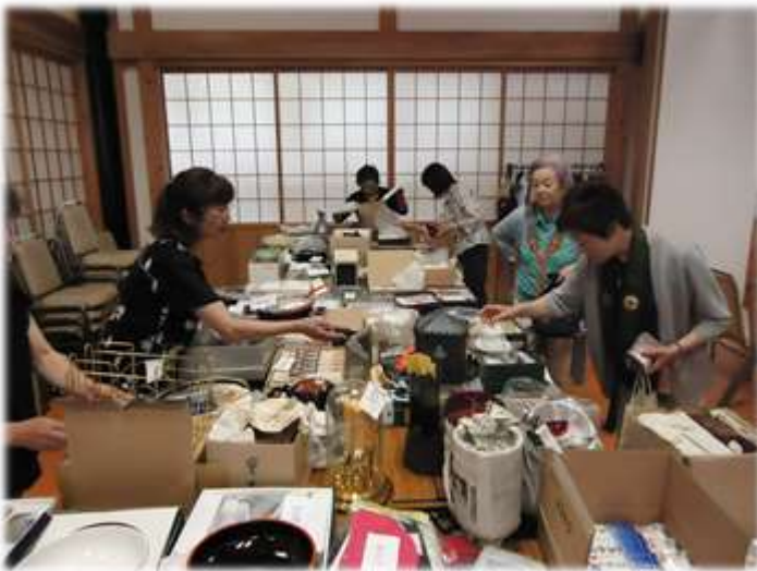
報恩講バザーの様子

台風でお客さんがなかなか来られない中、最初にお越しになられた方から沢山買っていただきました。持ち込み・値付け・配置等、時間をかけて準備したものが無事に売れて行くのはとても嬉しく感じます。ご支援ご協力をいただきまして、本当にありがとうございます。