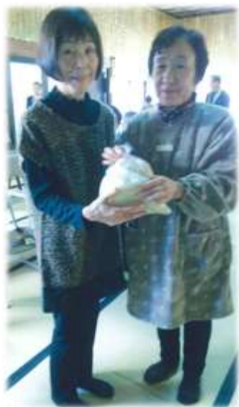
勝縁寺様報恩講での支援米配布の様子

このお米は宗派ボランティアセンター活動拠点の1つであります勝縁寺様(福島県南相馬市)を通じ、被災された方々へとお配りいただきました。今後ともご理解・ご協力をよろしくお願い致します。