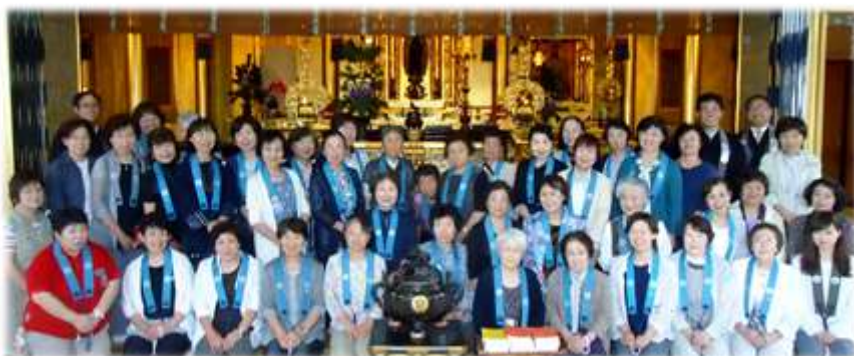
本願寺長野別院参拝

集合(各バス停留所) → 松代大本営跡見学 → 昼食 → 本願寺長野別院参拝 → 解散(各バス停留所)