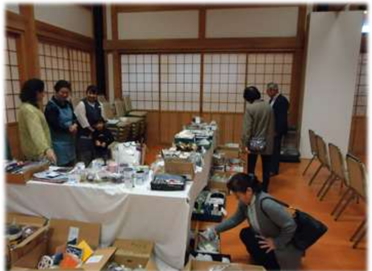
謝恩講バザーの様子

謝恩講ではバザーの品も少なく、参拝の方、お客さんも少なく困っておりましたが、職員の方や出勤の僧侶の方、受付スタッフの門徒推進員の方々のご協力をいただき、沢山の品物を売る事が出来た事、ありがたく嬉しく感じました。